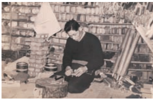
昭和初期の履物の主流でもあった下駄づくりに励む初代の姿。後ろには当時をしのぶ様に下駄がずらりと並んでいる。