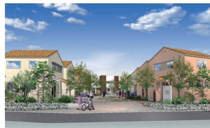
赤茶色のスパニッシュ瓦などを採用した外観は、南欧テイストで周辺環境と調和します。