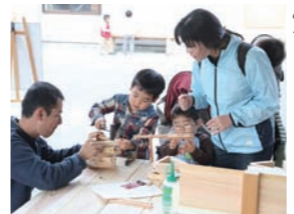
みんな上手にできたかな。

11の講座の中で一番人気だったのは「床 のへこみ補修講座」、次いで「檜ユニットバス のお手入れ講座」「玄関ドアのリメイク」に 多くの方が参加なさいました。お客様から 「日ごろ尋ねてみたいと思っていたお手入れ