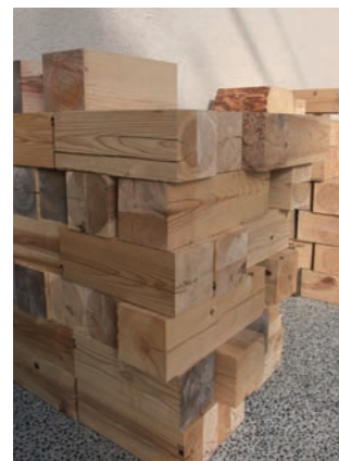
柱・梁の木片をご利用ください。

無料で配布(ご自身で運べる範囲)しますのでご利用ください。 (乗用車のトランクに入る量をお持ち帰りください。トラック等で大量に運ぶことはお断りしています)