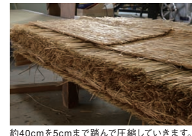
約40cmを5cmまで踏んで圧縮していきます。