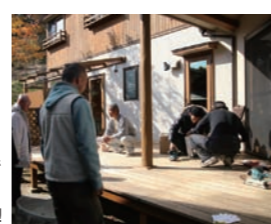
自分でやってみると意外に面白い!