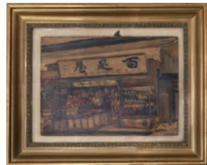
画家の長岡忠三郎作といわれる、創業当時の「むかでや」を描いた歴史的にも価値がある絵。