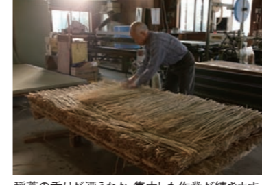
稲葉の香りが漂うなか、集中した作業が続きます。