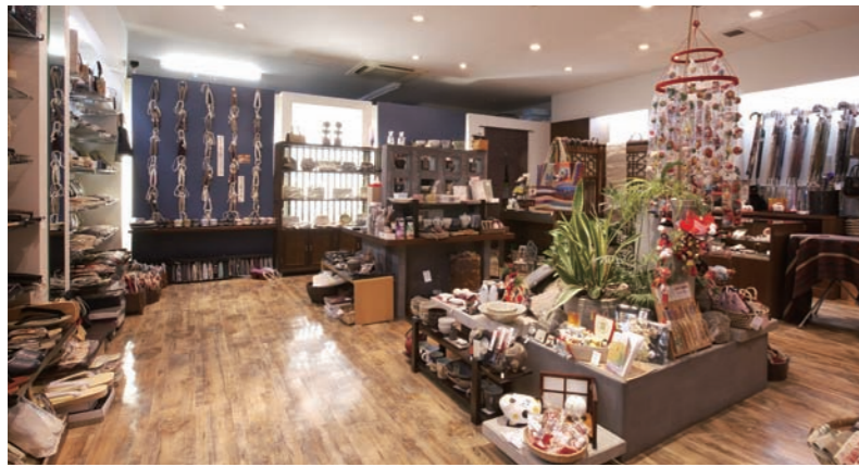
履物類から和の装いに至る小物までが揃う広い店内。