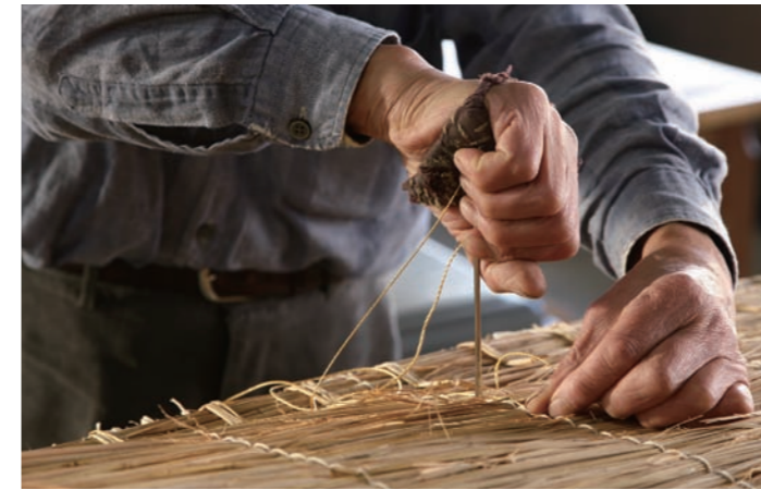
手間と時間のかかる「手縫い畳床」の技術は急速に失われています。