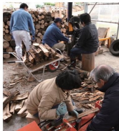
「薪ストーブの集い」での薪づくり。

※利用が多く品薄になる場合は、配布を制限させていただく場合がございます。予めご了承ください。(事前にお電話でご連絡ください)