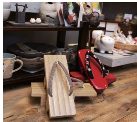
下駄や草履は、修理はもちろんのこと、鼻緒の調節からつけ換えまで気軽にに応じてくれる。

むかでや 仙台市青葉区一番町3丁目11-10 ●電話番号 / 022-2231-2063 ●営業時間 / 10時〜19時30分(年中無休) (仙台市一番町一番街商店街ぐらんどうむ) フォーラスより南へ5軒。ツルハドラック2Fです。