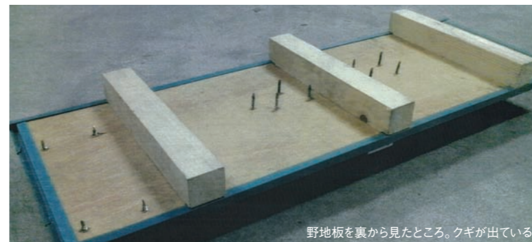
野地板を裏から見たところ。クギが出ている

ソーラーパネルを一般的な方法で施工すると「結露する」(下記イラスト参照)、「エアパス効果が低下する」など、四季工房の家にとって問題が発生します。